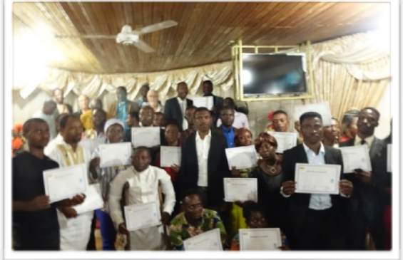
Quelques uns des stagiaires qui ont suivi le séminaire de formation à la communication radio à Ebolowa (octobre 2017)